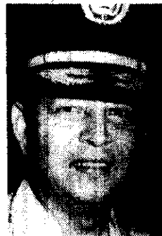
General Carlos Narváez

Afirmó que de todas maneras no hubo intención de causar desplantes a ninguno de los asistentes al acto.