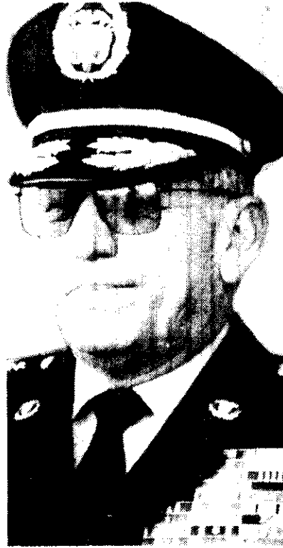
General Rafael Samudio Molina, ministro de Defensa.

Igualmente, el mayor general Oscar Botero Restrepo se dirigió a los familiares de soldados que prestan sus servicios en el Ejército. "A esta comunidad que aporta sus hijos al servicio militar: padres, madres,