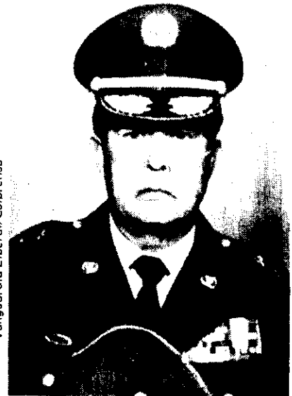
El nuevo subdirector general de la Policía Nacional, mayor general Jorge Arturo Pineda Osorio.

La nueva cúpula militar, formalizada hoy pero conocida desde la semana anterior, será reconocida por