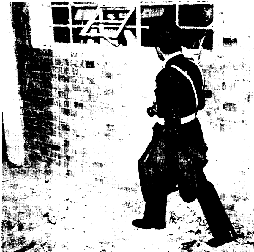
EL ESPECTADOR Jorge Torres

A medidados de octubre una poderosa explosión en Zipaquirá puso al descubierto una fábrica de bombas, con las que se pretendía sabotear el orden público cuando se conmemoraba el segundo paro cívico. En esa oportunidad un hombre perteneciente al grupo guerrillero perdió la vida y otra persona quedó gravemente herida. El mes pasado se dió cuenta de una escalada terrorista de atentados contra varias dependencias, entre las que se contaron varias Estaciones y subestaciones de Policía.