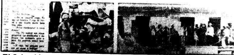
El Colombiano, junio 19 de 1971.