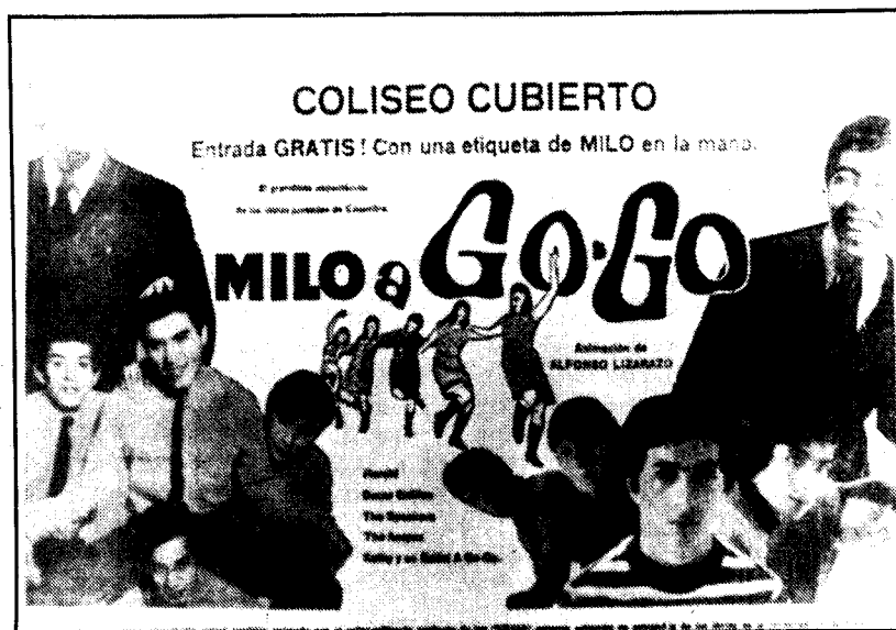
Un aviso en la prensa -El Colombiano, octubre 21 1966.

¡Estrenamos histeria colectiva!, en la bella Villa de La Candelaria. ¡Qué locura! ¿Qué pasa ahí en el centro, cerca al escenario? En medio de los ritmos nuevaoleros y los gritos, se ha formado un círculo. Desnudaron a una chica -a dos o tres dicen otros-. ¡Qué locura! Interviene la fuerza pública. Y con fuerza. Hay heridos. Gente que