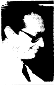
Por Victor Villa Mejía

La figura del malevo está emparentada con la historia del tango en Medellín. El habitante urbano encontró en tangos y milongas un canto a sus privaciones y esperanzas, a sus odios y afectos, a sus instintos primarios y secundarios. Crecer en los barrios populares era, y es, asimilar la melodía esquinera que como reiteración cotidiana enuncia que "el tango es macho", que "el tango es fuerte", que el tango "tiene olor a vida", que el tango "tiene gusto a muerte".